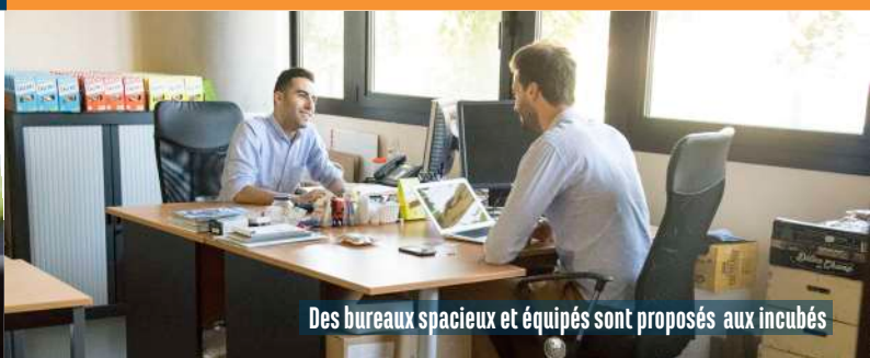
Des bureaux spacieux et équipés sont proposés aux incubés