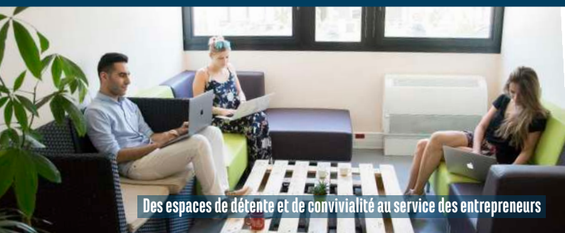
Des espaces de détente et de convivialité au service des entrepreneurs

DROIT D'ENTRÉE _____ 1 000€ SI CA CUMULÉ SUR 2 ANS > 50 000€ _____ 1 000€