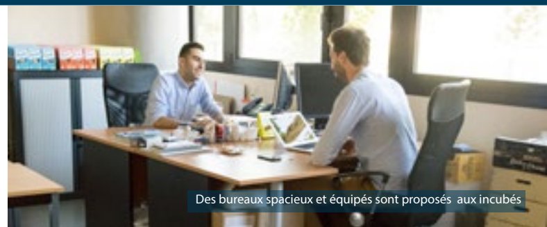
Des bureaux spacieux et équipés sont proposés aux incubés