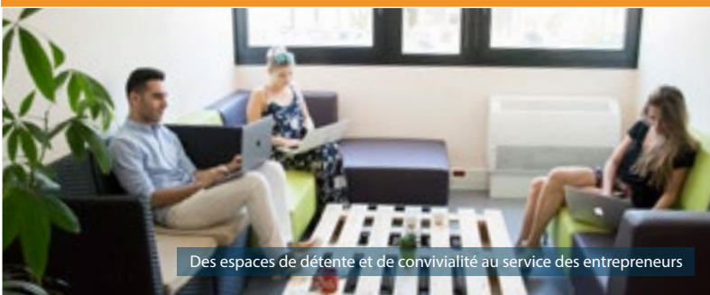
Des espaces de détente et de convivialité au service des entrepreneurs

DROIT D'ENTRÉE ————— 1 000€ SI CA CUMULÉ SUR 2 ANS > 50 000€ : 2 500€